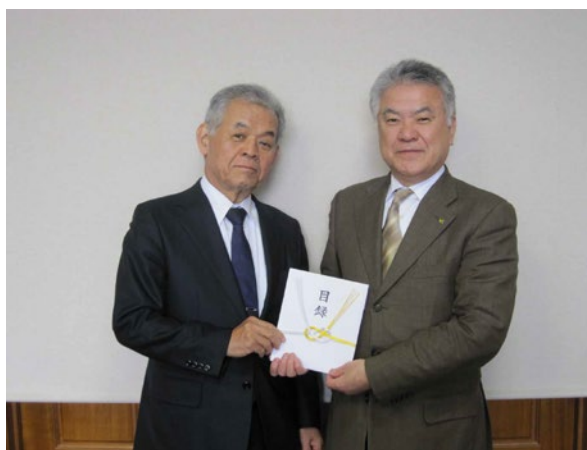
(左側：愛知銀行 矢澤頭取 右側：新城市 穂積市長)